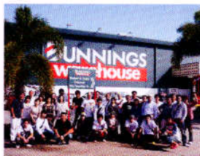
社員研修旅行(ケアンズ)

快適環境を演出するプランナーだからこそ、快適でゆとりのある仕事環境が必要。米津物産グループではオフィスや倉庫を快適・機能的に整備し、オープンな社風を確立して、社員が気持ちよく働けるよう職場環境を整えています。また福利厚生を充実させ、社員一人ひとりの快適ライフを応援しています。